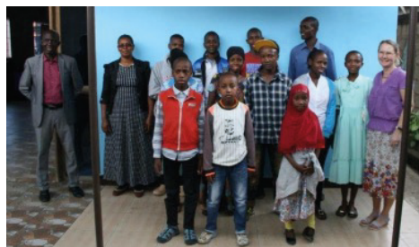
Zakana Youth gruppen.

Vi har for nyligt opstartet Zekana Youth gruppen. Gruppen består af 15 unge under 25, som har fået stillet diagnosen HIV. Denne gruppe er