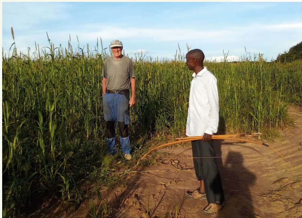
Verner i marken sammen med vagtmanden.

Senere på året bliver der høstet bananer, papaya og safflower, som er en olieholdig tidsel, som bruges til madolie og er modstandsdygtig overfor elefanter og fugle.