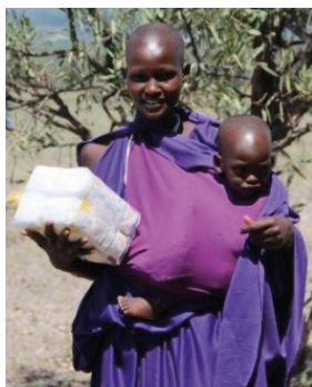
Uddeling af babymad.

Vær med til at stå sammen med os i arbejdet – bed, giv og gør din egen kirke opmærksom på, at der stadig er arbejde på missionsmarken, der skal gøres.