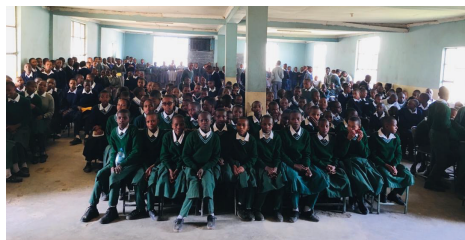
Mange skoler er primitive og uden strøm.

Tusind tak fordi I har så stort et hjerte for at hjælpe os med at bringe evangeliet til de mange elever på skolerne.