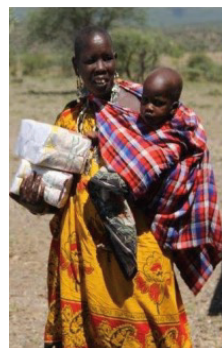
Smilene er store.