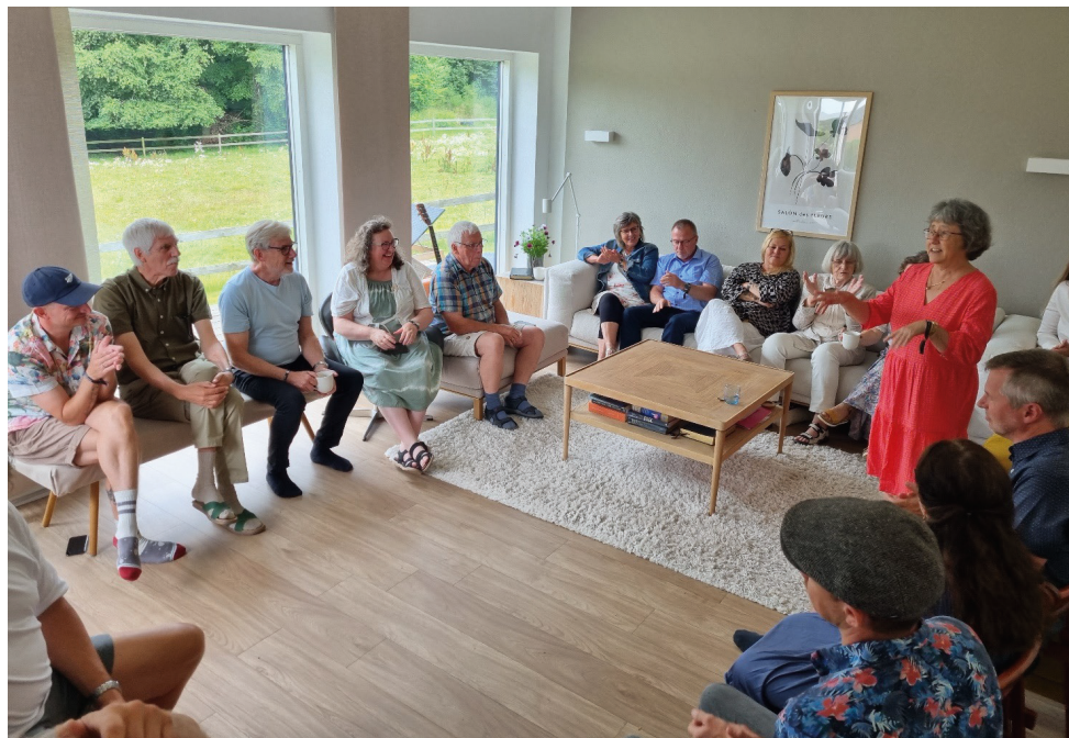
Der blev talt, bedt og delt liv.

Det er godt at kunne have fællesskab, fortælle, høre og bede for hinanden. Hold da op en rigdom, som der er i sådan en flok med brand for menneskers frelse og vel! På missionsmarken bliver der lært at have tro gennem