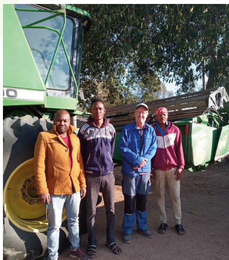
Verner sammen med landbrugsmedarbejdere.

Bed fortsat for at elefanterne ikke må ødelægge høsten og bed også for, at Guds ord må blive sået i god jord.