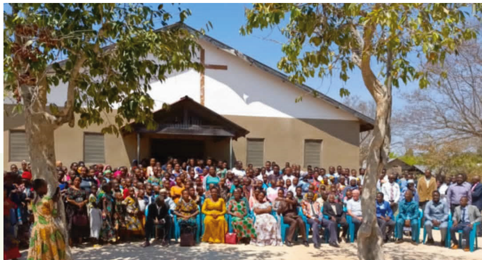
Fra vores dåbsgudstjeneste.

Vi er taknemlige for, at høsten af majs og hirse gik rimelig godt, selvom der har været problemer med elefanter og andre skadedyr. Vi deltog ikke selv i høsten i år, og det er en glæde at se, hvordan skolen bliver mere og mere selvstændig og formår at klare arbejdet selv ud fra de principper, vi har lært dem.