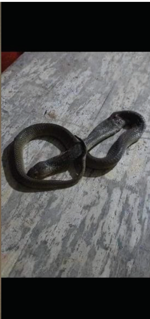
Disse slanger fandt vi ved vores børneklub. De lokale skar hovederne af dem og spiste kroppen.

Ta Ek. Det betyder at multibygningen som skal bruges til gudstjeneste, og aktiviteter hvor det er godt at være indenfor som fx til undervisning i IT, mindre gruppesamlinger eller musik, nu er færdig. Bygningen indeholder også et køkken, toilet og badefacilite-