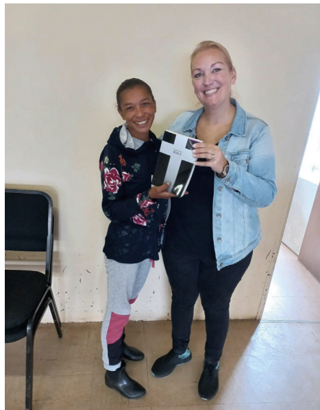
På kurset lærer man evige værdier.

det er ekstremt vigtigt for at skabe et fundament og fremtid for dem selv – men hvor vi også praktisk viser eleverne Jesus, og de får et møde med ham.