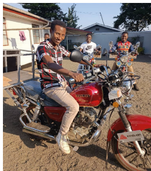
Teamet på deres motorcykler.

Disse unge når utroligt mange elever med evangeliet og rigtig mange tager