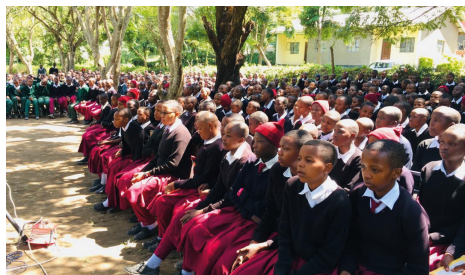
Eleverne er meget optagede af, hvad de hører.

imod Jesus og lader sig døbe og kommer ind i en kirke. Al ære til Jesus.