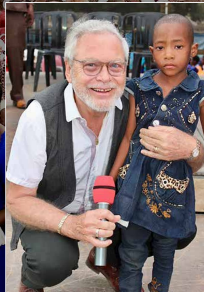
En lille pige var døvstum og blev helbredt, hun kan både høre og gentage ord vi siger til hende.