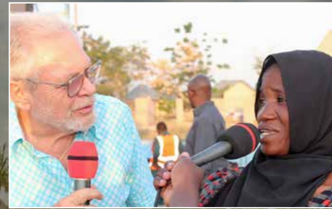
En muslimsk kvinde vover sig op på platformen og fortæller hun har taget imod Jesus.

Omkring 3000 mennesker lod sig registrere som ny-frelste og ønsker opfølgning. Det føles som vi er ved verdens ende; men hvilket stort privilegium det er at forkynde Kristus til dette folk. ♦