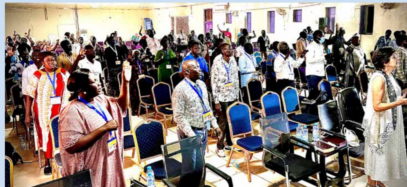
Tilbedelse og lovprisning til Gud var meget stærk med Helligåndens nærvær i Syd Sudan.

Syd Sudan har kun haft fred i godt et par år og alt er mere eller mindre ødelagt, fattigt og forfærdeligt elendigt. Krig er altid ødelæggende, ikke kun for et land men også for dets mennesker og efter mere end 50 år med en forfærdelig krig er freden endelig kommet til Sudan, men ødelæggelsen, fattigdommen og menneskelige sår er stadig mange.