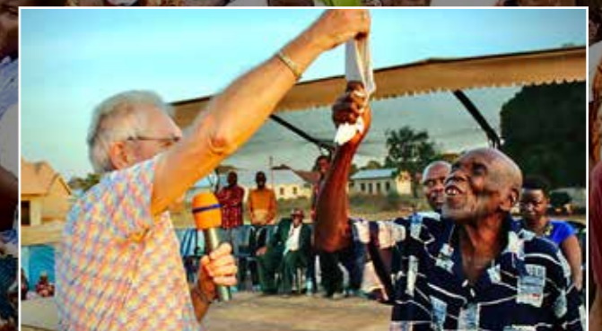
Blinde øjne blev seende og disse mennesker er jublende glade over at kunne se igen.