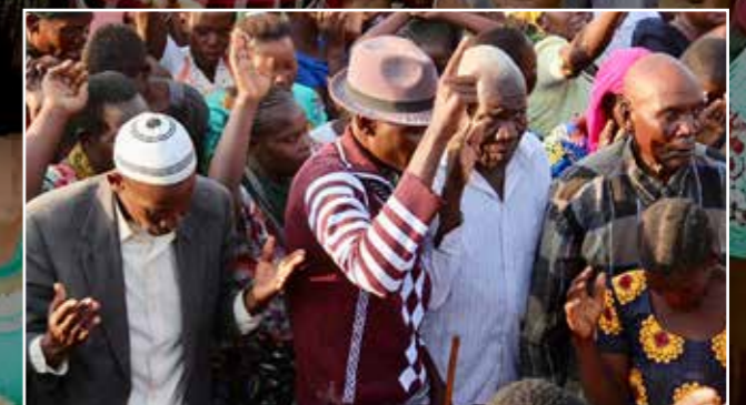
Gamle muslimske mænd står helt fremme ved platformen og ønsker at få det hele med