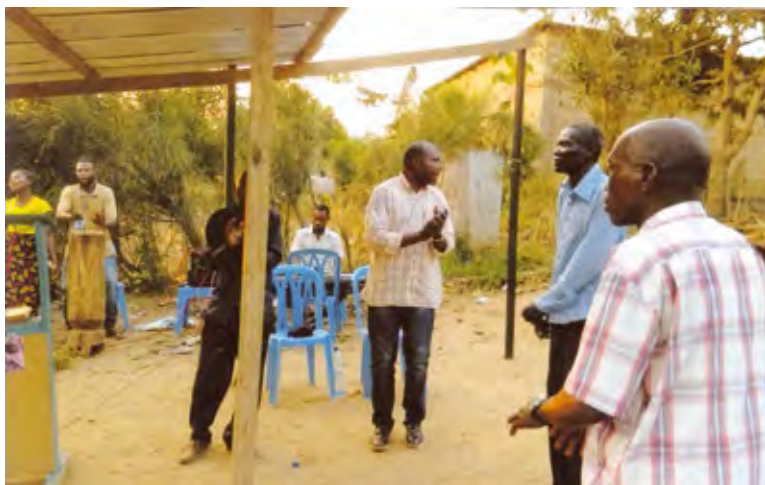
Congelos - folk begynder at samles - og nu er grunden købt!