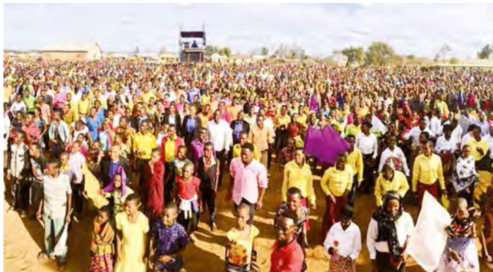
10.000 mennesker var samlet til kampagnemøderne om eftermiddagen i Itaja

Jeg har set de stærkeste og mest fantastiske helbredelser og mirakler der sker igen og igen. Jeg har set grimme og skræmmende dæmoner, der kastes ud af tusindvis af mennesker.