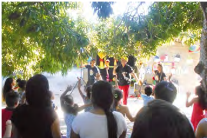
Underholdning ved årets børnefest

Vi så mange kære venner, og vi var i Macapa til 3 dages fejring af 100 året for Pinsebevægelsens komme til staten, og det var en meget trosstyrkende oplevelse med en lang række deltagende pinsekirker.