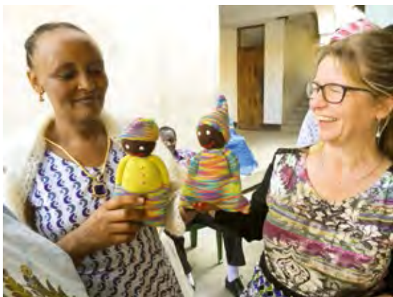
Dorrit med en af kvinderne fra 'H2H'

Dorrits har en strikkeklub i vores kirke i Blåhøj i Danmark ved navn 'HeartKnit'. Klubben gør et fantastisk arbejde og strikker børnetøj, som vi så tager med ud til blandt andet kvindegruppen 'Heart to Heart' (H2H) i Singida, Tanzania. Det er fantastisk at se resultaterne, og hvordan mange bliver mødt med hjælp og Guds kærlighed gennem dette arbejde, vi ser også hvordan det vokser i HeartKnit i Danmark, som nu tæller ca. 80 kvinder, og senest er en gruppe i Holland startet!