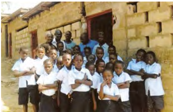
3. og 4. klasse foran skolen i Kimwenza