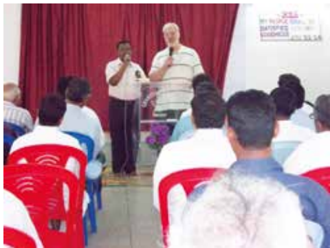
Pastorseminar om discipelskabstræning