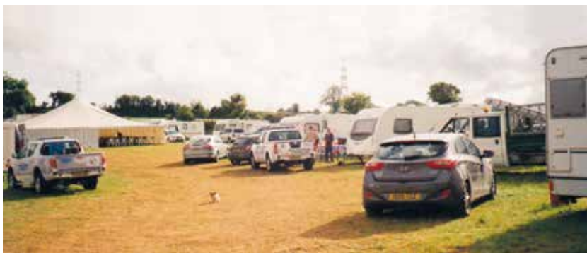
Teltkampagne og stævne hos de rejsende folk i Cork i juni 2015