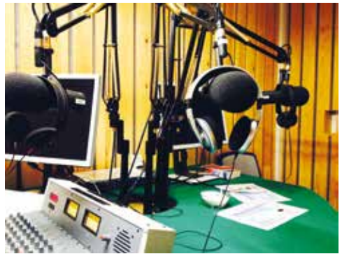
Radiostudiet i Nuuk