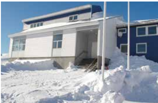
Kirken i Nuuk

Det er vel værd at overveje. Vi har mulighed for at indkvartere en mindre gruppe. Vi har VERDENS BEDSTE BUDSKAB og VERDENS BEDSTE fritids- og natur-oplevelser lige uden for døren!!