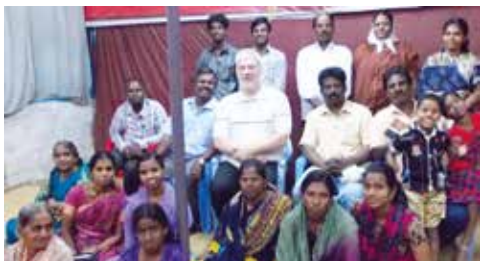
Lederskabstræning i sjælevinding

Der blev afholdt mange træningsseminarer for medarbejdere og undervist på forskellige Bibelskoler. Emnet var hovedsageligt, hvordan den enkelte kan forberede sig på at blive en effektiv sjælevinder. Jesus sagde: Følg mig, så vil jeg gøre jer til menneskefi-