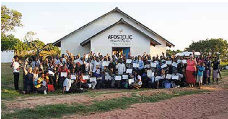
Deltagere fra vores PowerClub træning i Kazembe, Luapula Provinsen

At vi alligevel deler tallene med jer denne gang, er fordi der bag ved tallene, gemmer sig andre tal – udgifter. Vores aktiviteter i år har været langt flere end tidligere, og vi har derfor brugt flere midler end tidligere år – men det er vi egentlig ikke kedede af, pengene har været givet godt ud.