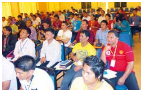
Gæstearbejdere fra Nepal

Mens jeg var i Klang havde jeg anledning til at tale til en større samling af gæstearbejdere fra Nepal. Når man tænker på de mange millioner af unge i sydøstasien som endnu ikke kender Jesus, kommer ens hjerte til at brænde med en byrde for at de må blive nået af evangeliet. Selvfølgelig er det ikke kun de unge - Guds hjerte brænder for at enhver må modtage Hans Søn som frelser,