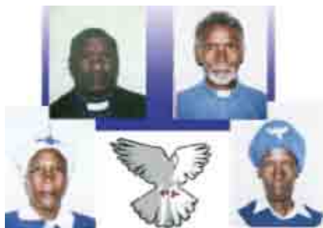
Ledere i: 'Guds Engles Åndelige Kirke'

de kommer i, - og at tilbyde skræddersyede undervisnings-programmer til pastorer og medarbejdere, uanset hvilke menigheder de er ledere i, blot de ønsker at kende mere til Guds ord og blive bedre udrustet til deres hverv. Det er et stort behov i Guds Rige. Der er altså tre oplagte missionsfelter: