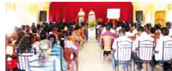
Pastor-seminar i Batticolore

Gud gav mig også en vidunderlig tid i Batticolore på Sri Lankas østkyst. Det er netop et af de steder, hvor sunamien ramte særligt hårdt for godt 10 år siden - jeg besøgte en