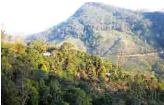
Te-plantager i bjergene nær Kandi

Helt specielt var det, at bede sammen med en ung mand, som var kriminel. Søsteren til Kumars vens kone er gift med en mand, som voldte hende store problemer, på trods af at hun har en god stilling og er en bedende kvinde. Hendes mand var netop blevet løsladt mod en større kaution og var lige kommet tilbage til Chennai fra Kalkutta dagen før.