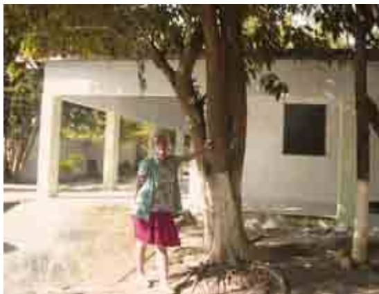
Kirsten foran det nye rehabiliteringshus

Der er fortsat kæmpestore sociale problemer, uden nogen lette hurtige løsninger, men mange kirker har specielle bedekampanjer og også nogle sociale initiativer, dog langtfra i målestok med behovene.