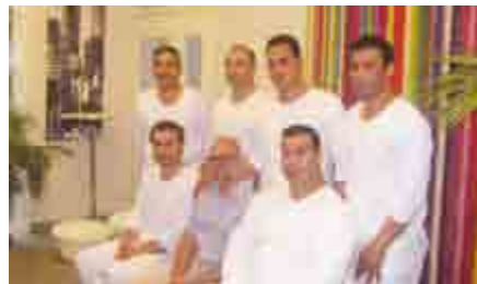
6 af 8 nye troende der blev døbt i maj 2014