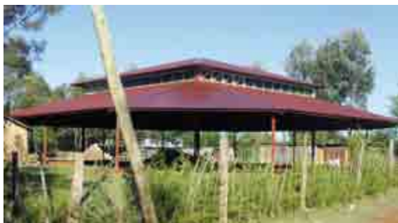
Uden lastbil og kran kunne vi ikke bygge en sådan kirke

Siden vi fik den nye lastbil har vi rejst cirka 1275 tagkonstruktioner til kirker, skoler, børnehjem og klinikker. Vi bruger dog ikke lastbilen til alle byggerier men 'kun' til de helt store, hvor kranen er et helt nødvendigt værktøj.