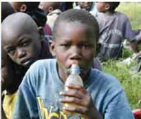
En af de første lim-sniffende gadebørn vi hjalp

haveklasser, 61 i gymnasiet, 30 på Colleges, 15 på Universiteter, 30 på syskole, 50 børn unge og voksne i voksenskole, og 100 af børnene bor på børnehjemmene. Alt dette kan kun lade sig gøre ved Guds hjælp og fordi mennesker er villige til at støtte.