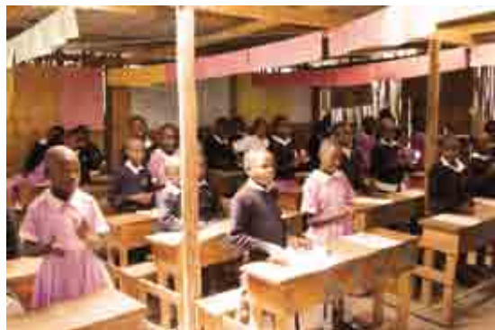
Børnene i de gamle klasseværelser

I 2012 var de for første gang en tur hjemme i Kenya igen og besøge deres venner og familie. Denne rejse blev endnu dyrere, for nu havde de 3 børn, og de skulle have returbilletter. Igen søgte vi Missionsfonden om hjælp til rejsen, da det ellers ville være umuligt for dem at rejse pengene.