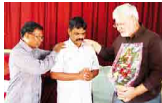
Indsættelse af en ny pastor

Gud gav mig også en skøn tid i Colombo, hvor jeg igen var rundt i store og mellemstore kirker og søgte at styrke de troende blandt andet ved at undervise om forbøn. Forbøn er jo netop det element, som er den essentielle forløber for effektiv evangelisering - så hvis vi f.eks. ønsker at se den singalesiske befolkning på Sri Lanka vende sig til Herren, vil tilgivelse og forbøn komme før kraftfuld evangelisation. Når vi som samlet flok får nød for sjæle, vil Gud oprejse tjenester, som kan bringe høsten i hus.