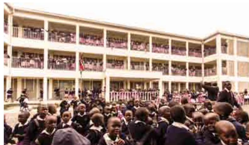
Den nye skolebygning med eleverne samlet foran og på balkonerne

Du kan også læse bladet Missions-Nyt på www.missionsfonden.dk