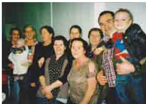
Fire generationer i kirken i Cork.

andre byer indenfor en radius af 40-80 km. For kun nogle uger siden kom der nogen fra hovedstaden Dublin, 250 km. herfra. De var på familiebesøg og blev frelst hér og er kommer her meget siden.