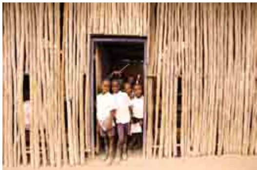
Vores første primitive 'skolestuer'

Du kan også læse bladet Missions-Nyt på www.missionsfonden.dk