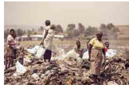
Lossepladsen er livsgrundlag for mange