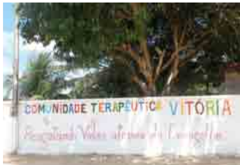
Muren omkring rehabiliteringshjemmet

tionale medarbejdere med mod til at hjælpe i et sådant arbejde. Midt i den opskuede fodboldstemning, er Guds folk er i forvening til, at noget skal ske.