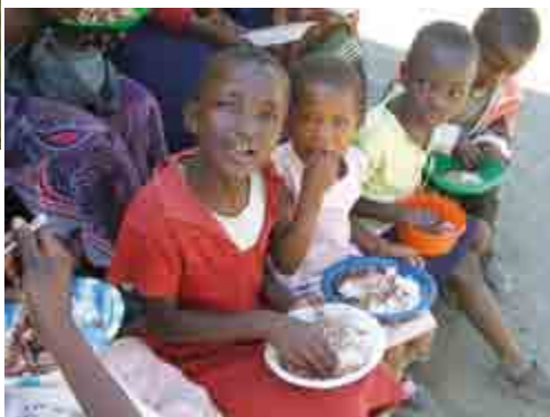
Bespising af børnene i starten

I 2003 startede vi med at hjælpe piger, som har det meget svært og har brug for et sted være og opleve omsorg. Og fra 2005 til 2007 følte vi, at Gud ledte os til at bygge et nyt stort 2 etages hus til fattige hjemløse og forældreløse piger, som har stor brug for hjælp. Det tog os cirka 3 år, at samle penge ind og bygge huset. Det var en stor opmuntring for os at Missionsfonden også gik ind og