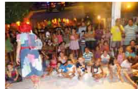
Forestilling på Broadway i Canoa Quebrada i påsken for publikum til børneprogram