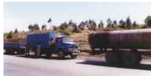
Den gamle lastbil måtte trækkes op ad bakken

Vi fandt den helt rigtige lastbil i Danmark – og ligeledes en kran. Men der skulle ikke bare økonomiske mirakler til. For da lastbilen var klar til at blive sendt til Kenya, viste det sig, at det ikke var tilladt at importere køretøjer med rattet siddende i venstre side! (I Kenya kører vi i venstre side af vejen). Og desuden kunne man ikke længere få fuld fritagelse for told på importerede køretøjer. Vi var i forvejen økonomisk hårdt trængt – så det var et stort problem. Men – et mirakel skete – og efter at vores dengang knap 12 årige søn bogstaveligt talt havde råbt til Gud om, at regeringen måtte ændre loven – så ændrede regeringen dagen efter loven, så vi kunne importere lastbilen – og endda få fuld toldfritagelse.