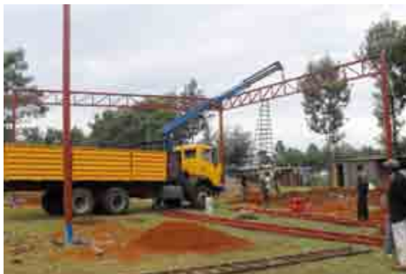
Den nye lastbil i brug

Der var stadig en del arbejde med at få lastbilen gjort klar til missionsarbejdet, og her modtog vi en gave på 16.000 kr fra Missionsfonden, hvilket var helt fantastisk for os.