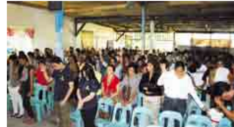
Evangelisk møde i en pinsekirke

radikalt budskab om at følge Jesus. Hundredevis af mennesker ønskede forbøn efter mødet og mange oplevede Guds kraft og nærvær. Efter mødet uddelte vi risposer til mødedeltagerne. Vi aftalte med pastoren af kirken, at vi ville komme tilbage og have flere møder med dem.