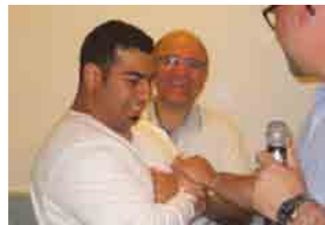
Vali of Kenneth velsigner Davud

I tiden herefter åbnede Gud en dør til det farsitalende miljø i Danmark. Ret hurtigt begyndte vi at få kontakter på asylcentre med mennesker, der ønskede at besøge kirken og høre evangeliet. Vi fornemmede, at vi stod midt i en mark, der var moden til høst, og at Gud