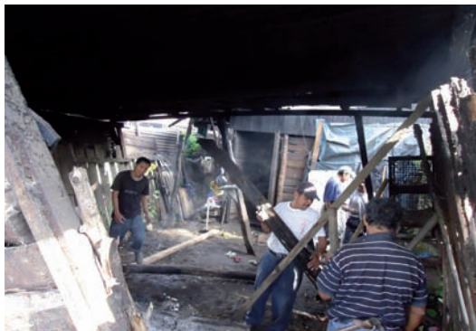
Hvor skal vi begynde?

Jeg håber og beder om, at I vil bede for mig, både for arbejdet og for min økonomi, så jeg kan komme derud og være til velsignelse, fordi Gud går foran og velsigner.