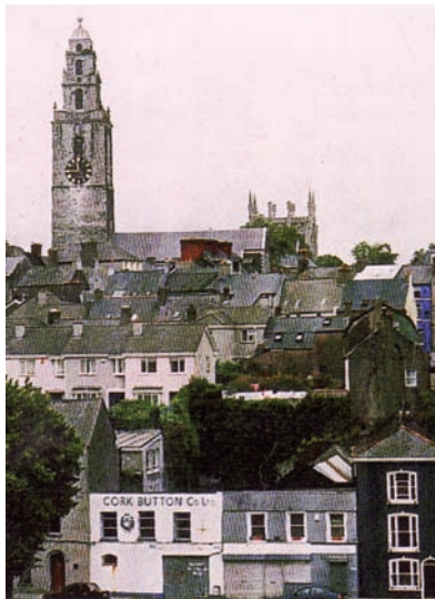
Ejendommen Cork Button Co. ligger lige i byens centrum ved floden. Den bedste placering i Cork hvad evangelisation angår

ste til evangelisation i byen. Vi regner også med, at der kan etableres en vis parkering. Forhandlingerne er begyndt - og vi beder.