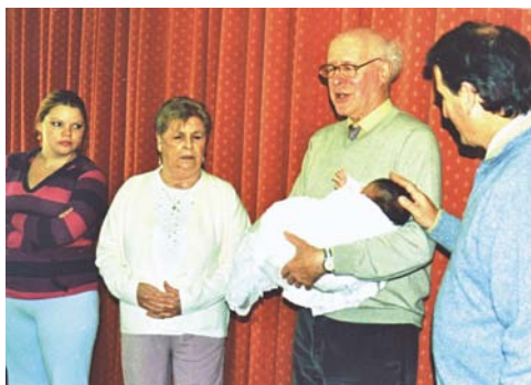
Barnevelsignelse. Marys barnebarn er alene med sin baby men ønskede, at vi skulle bede for barnet i kirken

Dengang kendte hun ikke et eneste bogstav, men hun ønskede så inderligt at kunne læse Guds Ord. Og Gud lærte hende at læse! - Det er ikke helt