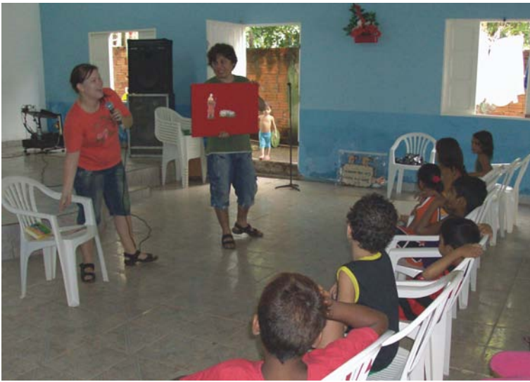
Ligningen om den gode hyrde fortælles med flonellograf

nene oplever ikke meget opbakning fra deres forældre i det daglige og kalder dem ofte ved skælsord.