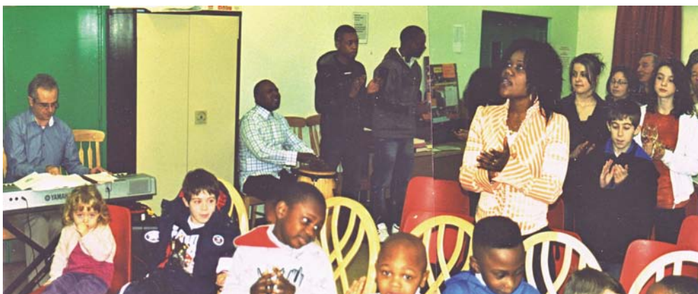
Lille udsnit af forsamlingen i Cork. Alle andre og forskellige nationaliteter