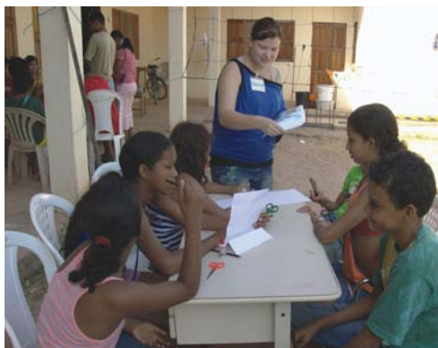
Tegnelektion på ungdomslejren