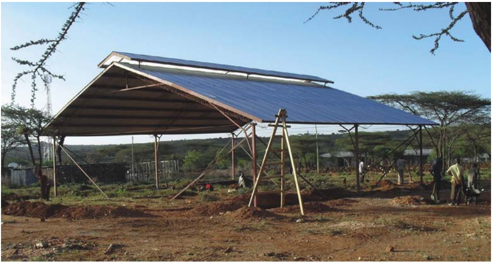
Kirkebygningen i Citam Baragoi i Nordkenya da tagkonstruktionen kom på plads