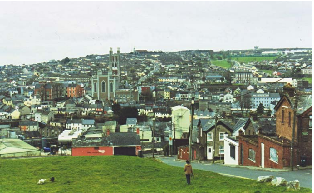
Store stejle bakker. Udsigt over Cork